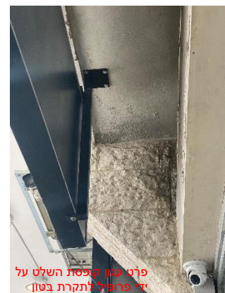
פרט עגון קופסת השלט על ידי פרופיל לתקרת בטון